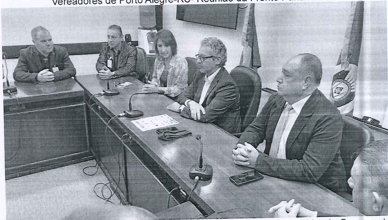
Reunião com o Exmo. Sr. Deputado Estadual Frederico Antunes – Líder do Governo do Estado na Assembleia Legislativa do Estado do Rio Grande do Sul (Porto Alegre-RS) Dia 25/05/2023