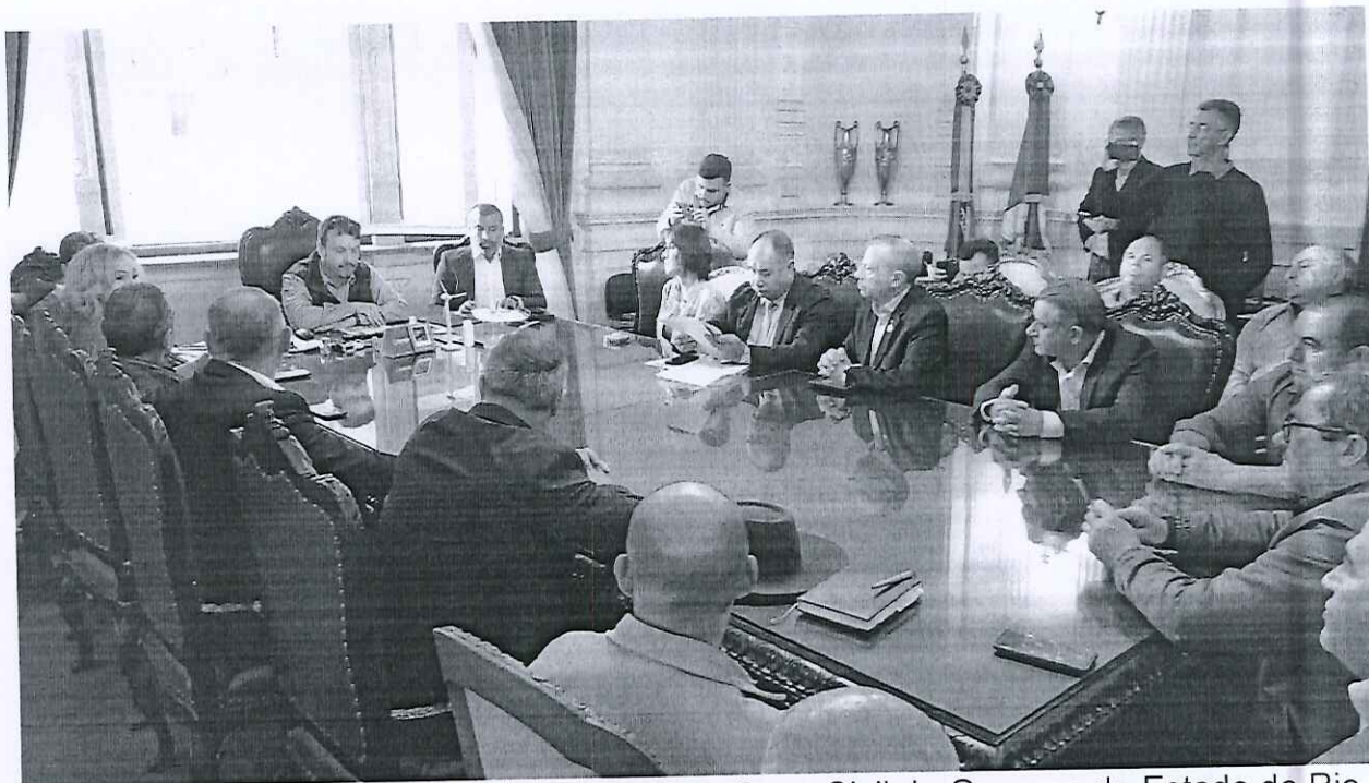
Reunião – Exmo. Sr. Artur Lemes, Chefe da Casa Civil do Governo do Estado do Rio Grande do Sul – Palácio Piratini (Porto Alegre-RS) Dia 25/05/2023